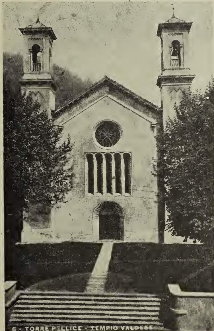
Valles Valdeses. — El Templo principal de Torre Pellice, en donde cada año se celebra el Culto de apertura del Sínodo, y la consagración de los candidatos al Santo Ministerio

Nuestra Iglesia Valdense fué suscitada por